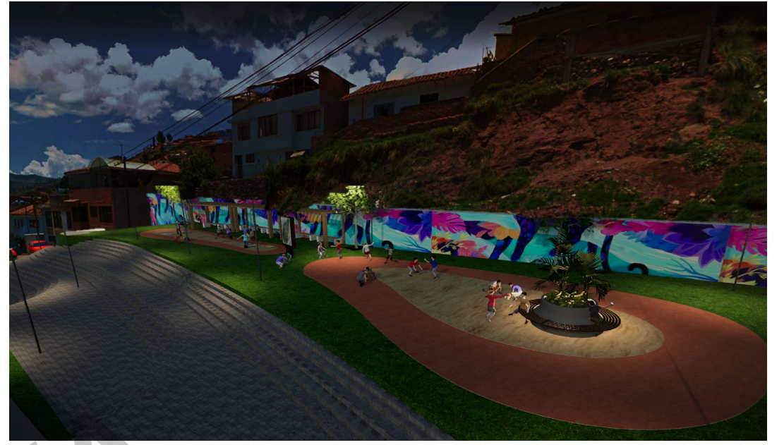
VISTA 01 PROPUESTA DE ILUMINACION PARQUE