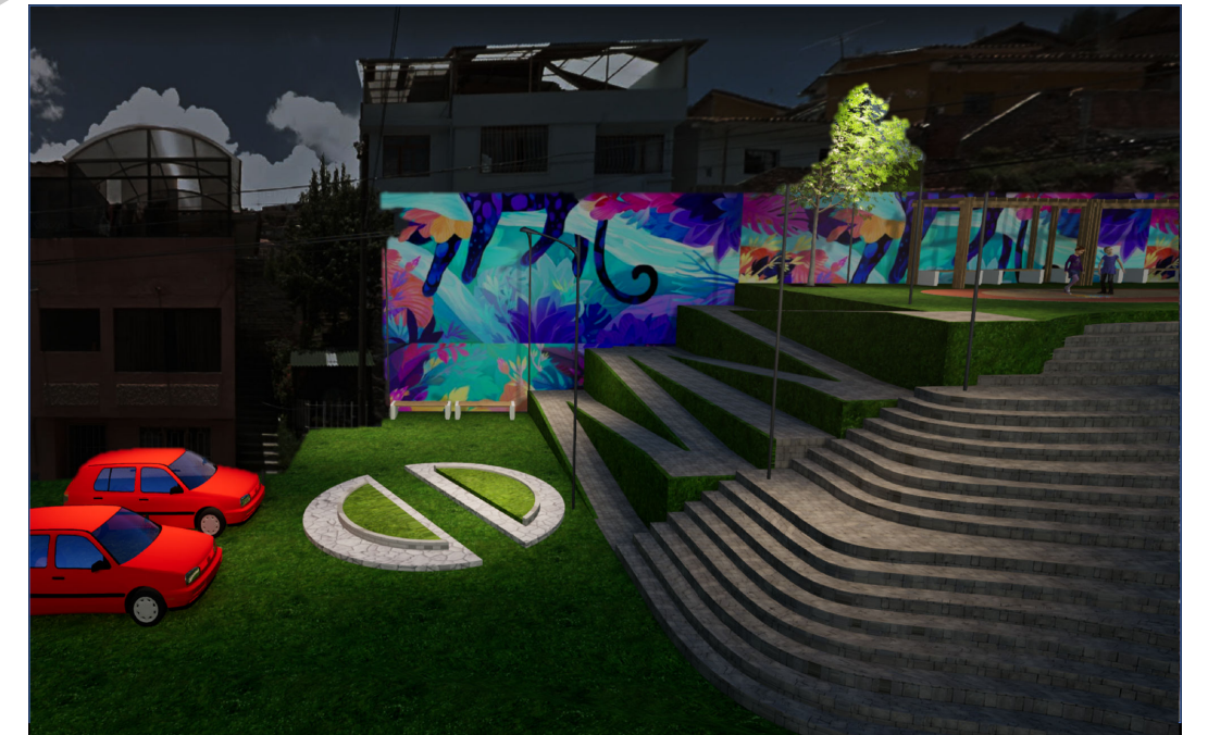
VISTA 02 PROPUESTA DE ILUMINACION PARQUE